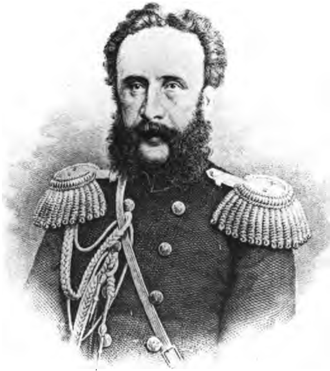
Баронъ Л. К. Усларъ.