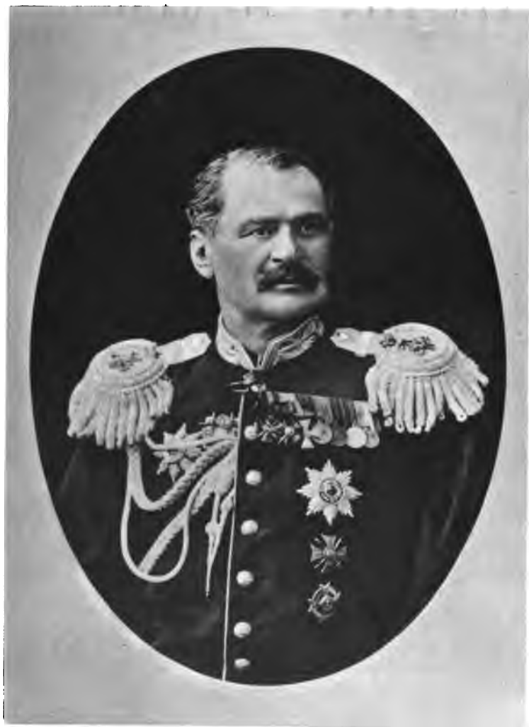
Князь Н. В. Чавчавадзе.