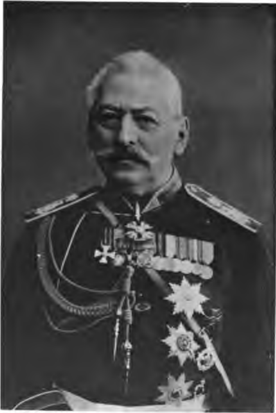
Князь Д. И. Меликовъ.